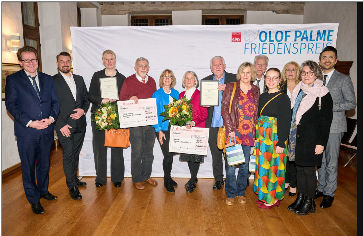
Preisträger des Olof-Palme-Friedenspreises 2023 am 28.02.2023 in Schloss Reinbek