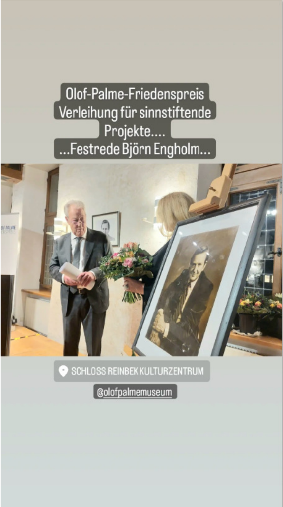
© Rainer Neumann (im Nachfolgenden RN abgekürzt)