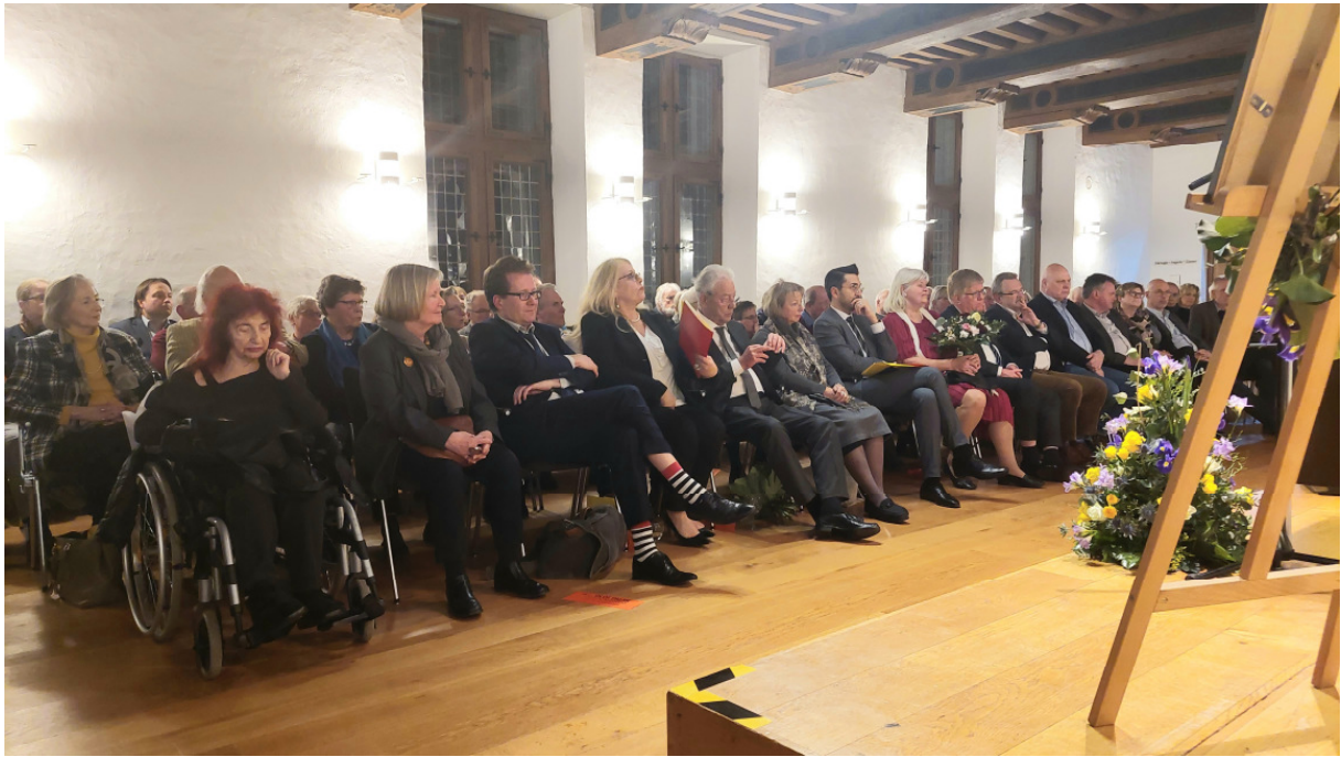
Festsaal im Schloss Reinbek am 28.02.2023