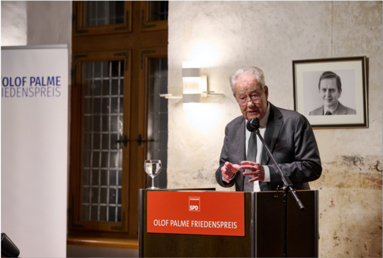
Festrede Björn Engholm