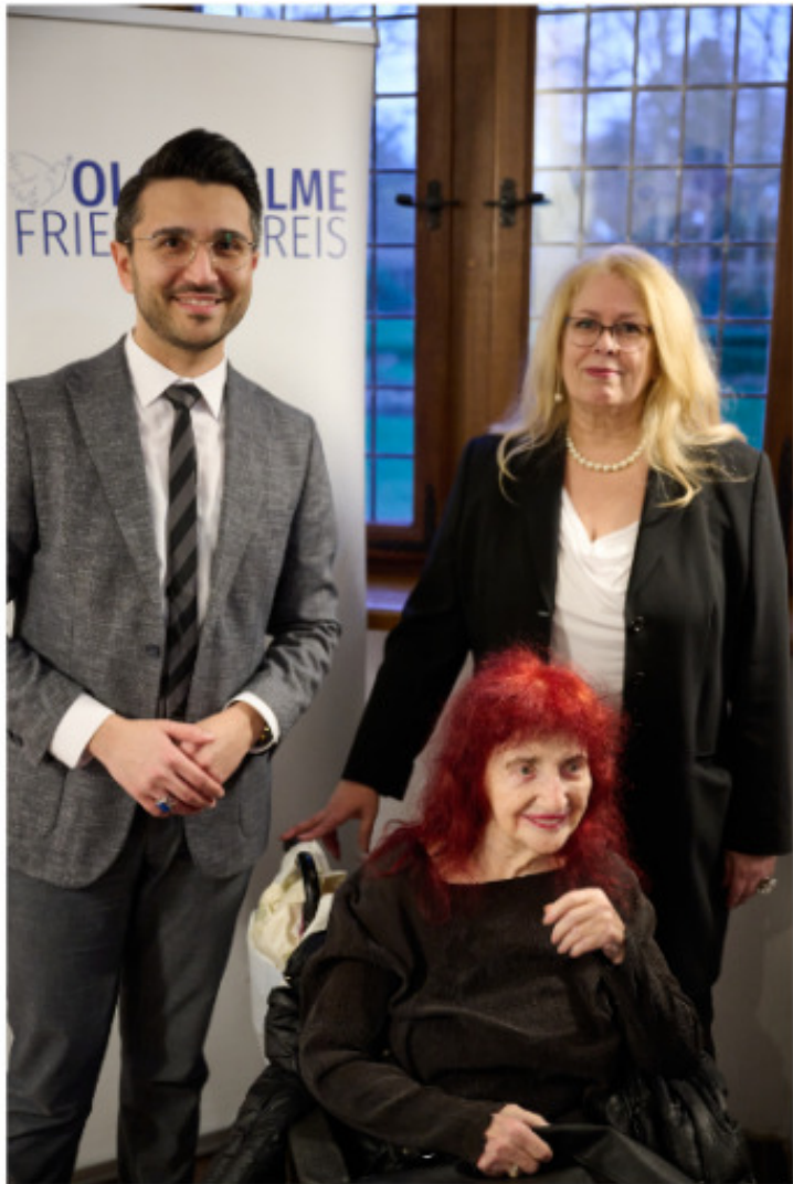
Peggy mit beiden Vorsitzenden der SPD-Stormarn